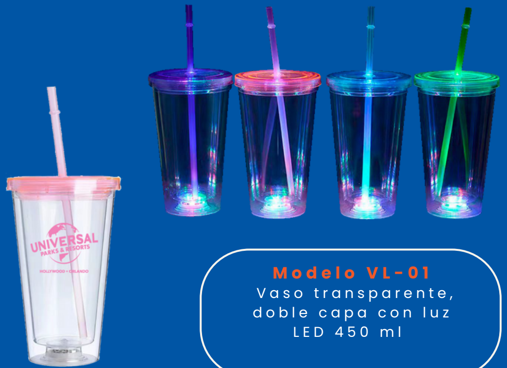
Modelo VL-01 Vaso transparente, doble capa con luz LED 450 ml