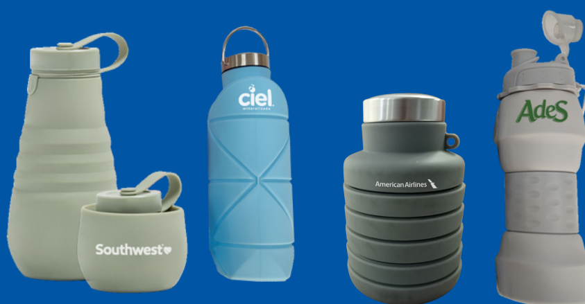
Modelo BSL-01 Botellas de Silicón Colapsable de 500/550/750ml