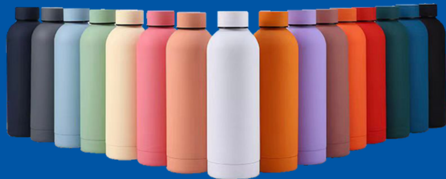
Modelo BA-01 Botella de Acero Inoxidable de 500 ml