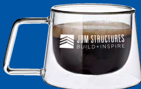
Modelo TCNT-01 Taza de vidrio doble pared para producto caliente 150ml