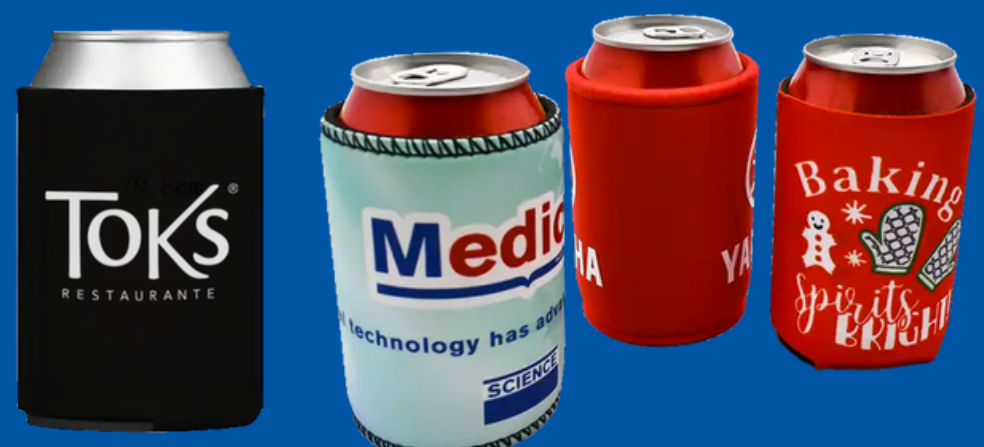
Modelo FLNT Funda personalizada para lata