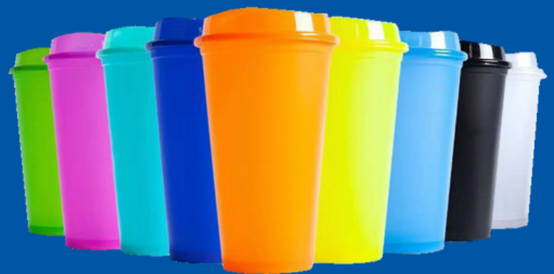
Modelo VS-02 Vaso Térmico de Plástico 475 ML