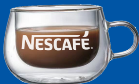
Modelo TCNT-02 Taza de vidrio doble pared para producto caliente 250ml