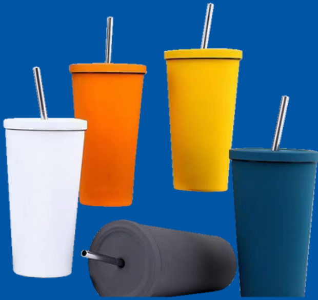
Modelo NT-VAI Vaso de Acero Inoxidable con Popote de 500ml