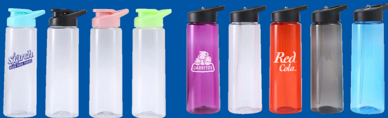
Modelo BA-04 Botellas de Plástico