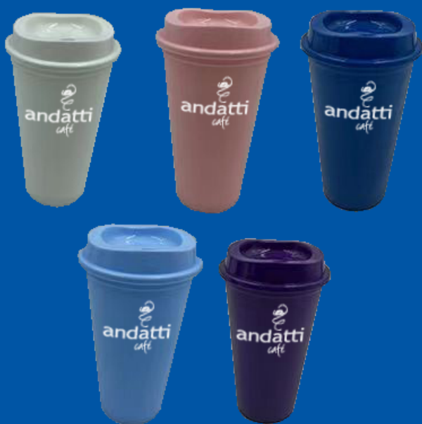
Modelo VS-03 Vaso de Plástico 500ml