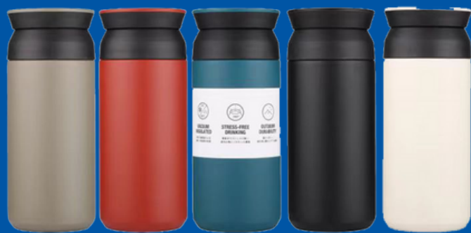
Modelo BA-02 Termo de Viaje 350 y 500 ml