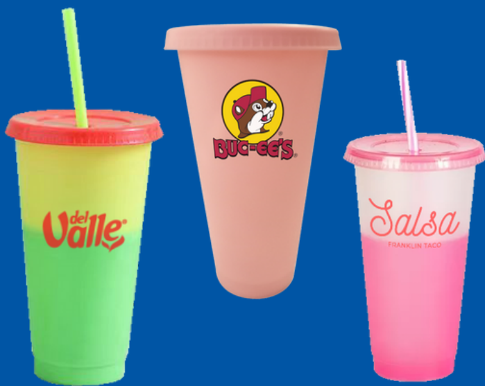
Modelo VS-01 Vaso Térmico de Plástico 710ML