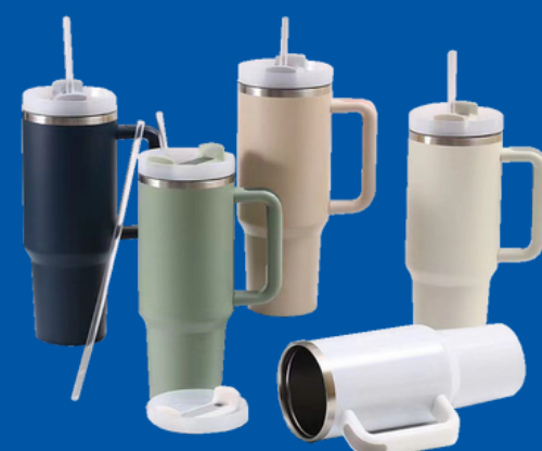
Modelo TRM-01 Termo de Acero Inoxidable de 20oz y 40oz