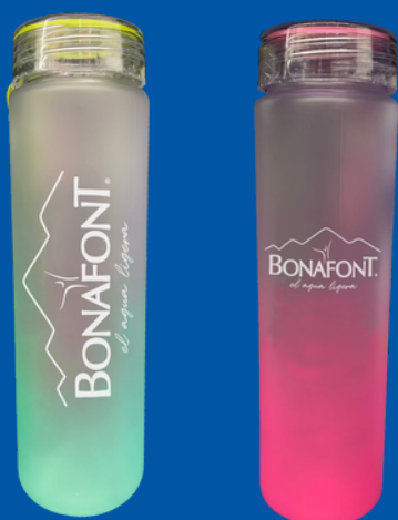
Modelo BA-03 Botella de Plástico