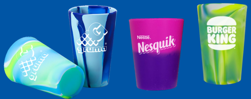
Modelo NT-VS Vasos de Silicón de 280/420/480/500/ 600ML